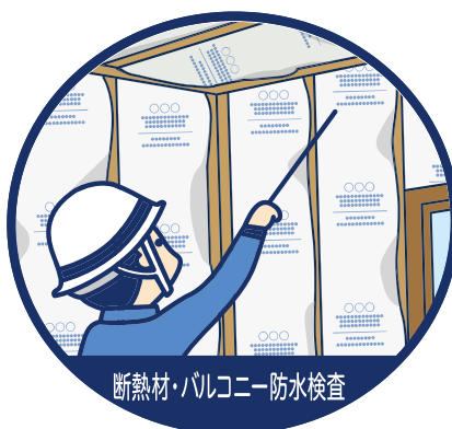
断熱材・バルコニー防水検査